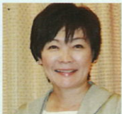
安倍昭恵 (第98代総理夫人)