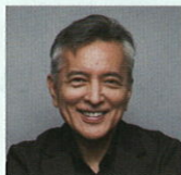
榎木孝明 (俳優・画家)