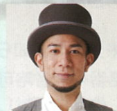
グローバー (ミュージシャン タレント)