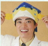
さかなクン (東京海洋大学 名誉博士・客員教授)