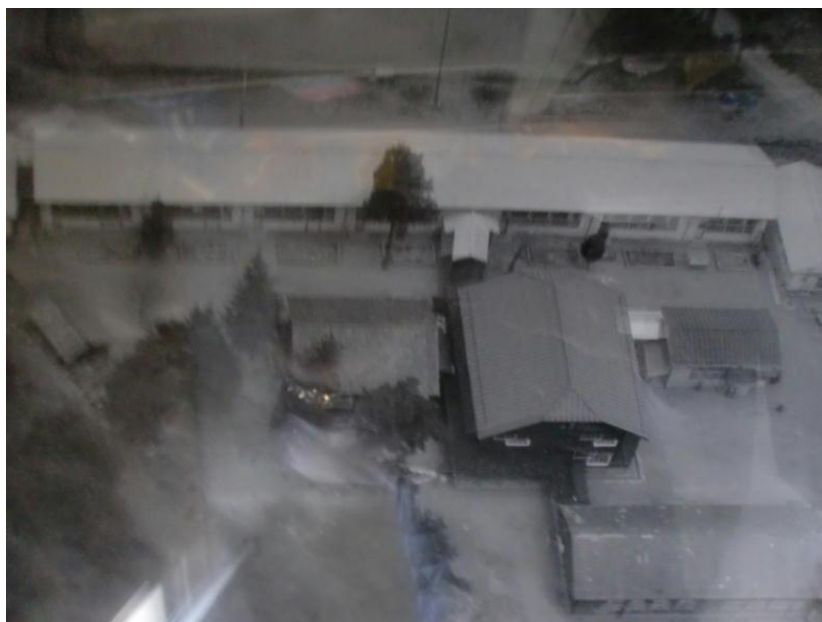
< 1965年(昭和40年)千代田小学校 >

現在の千代田小学校は「心豊かでたくましく、自ら学び、自ら考え、実践する子どもの育成」という学校教育目標を掲げ、確かな学力の充実、一分間スピーチ、一輪車、福祉施設千代田荘との交流、全校合唱、全校体育など特色ある教育活動を展開しています。また、「千代田探検」をテーマに、伝統文化や環境学習、伝統食など新たな学習課題にも取り組んでいます。少人数ですが、「個が生きる一人一人が主役の千代田小学校」をめざして日々の学びを大切にしています。