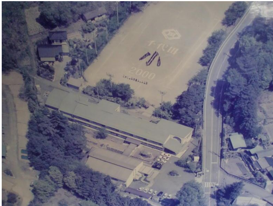
<2000年(平成12年)千代田小学校 >