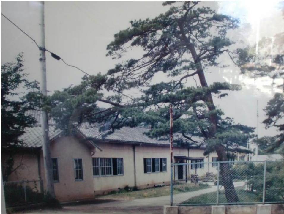
<1984年(昭和59年)千代田小学校 >