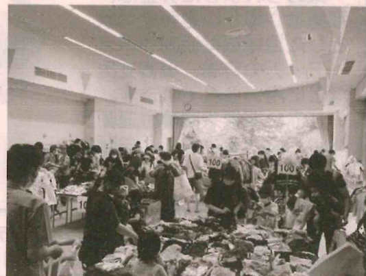
(写真は、本年7月に開催した「おゆずり会」の様子です。)

○譲渡物品：就学前(0～6歳)の乳幼児が使用する物品 服(130cmまで)、帽子、靴(19cmまで) 下着(未使用)、紙オムツ(未開封) 子ども用寝具、ベビーソファ など