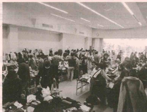
(写真は、昨年12月に開催した「おゆずり会」の様子です。)