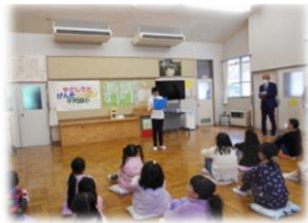
【4月7日始業式の様子】